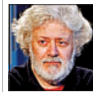
Mario Gas Director y actor teatral

El hoy director del Teatro Español de Madrid regresa a Barcelona desde este miércoles en el Romea con Homebody Kabul , la aclamada obra de Tony Kushner, una crítica feroz de todos los fundamentalismos.