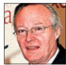
Josep Piqué Exlíder del PP en Catalunya

Una biografía del que fuera presidente del PPC hasta el verano pasado explica las causas de su renuncia según testimonios de amigos suyos. La principal, su «decepción personal» con Mariano Rajoy.