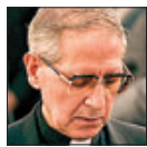
Adolfo Nicolás Nuevo superior de los jesuitas

Los 217 electores reunidos en su 35 congregación general han elegido en la segunda votación a este palentino de 72 años, 46 de los cuales ha pasado en Asia, principalmente en Japón, y últimamente en Filipinas.