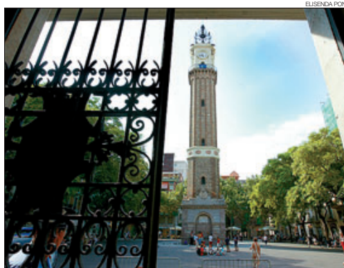
► La plaza de Rius i Taulet, con el característico reloj.