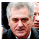
Tomislav Nikolic Político serbio

La victoria de este candidato ultranacionalista en las elecciones presidenciales de Serbia que se celebran hoy supondría un alejamiento de Europa y una vuelta a la peligrosa inestabilidad en los Balcanes.